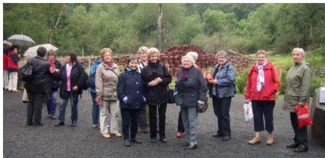
Foto: Ausflug Frauengemeinschaft Hermeskeil

Wo nähere Angaben im Programm fehlen, bitte die Informationen im Schaukasten, im kirchlichen Mitteilungsblatt und in der Presse beachten. Zu den Veranstaltungen sind alle Frauen eingeladen, besonders auch aus der Pfarreiengemeinschaft.