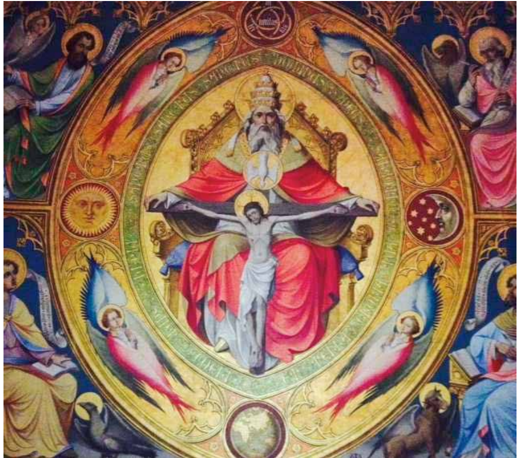
Altarretable aus dem Kölner Dom - Darstellung des Gnadenstuhls

Seite 23: Praktikantin im MGH Johanneshaus