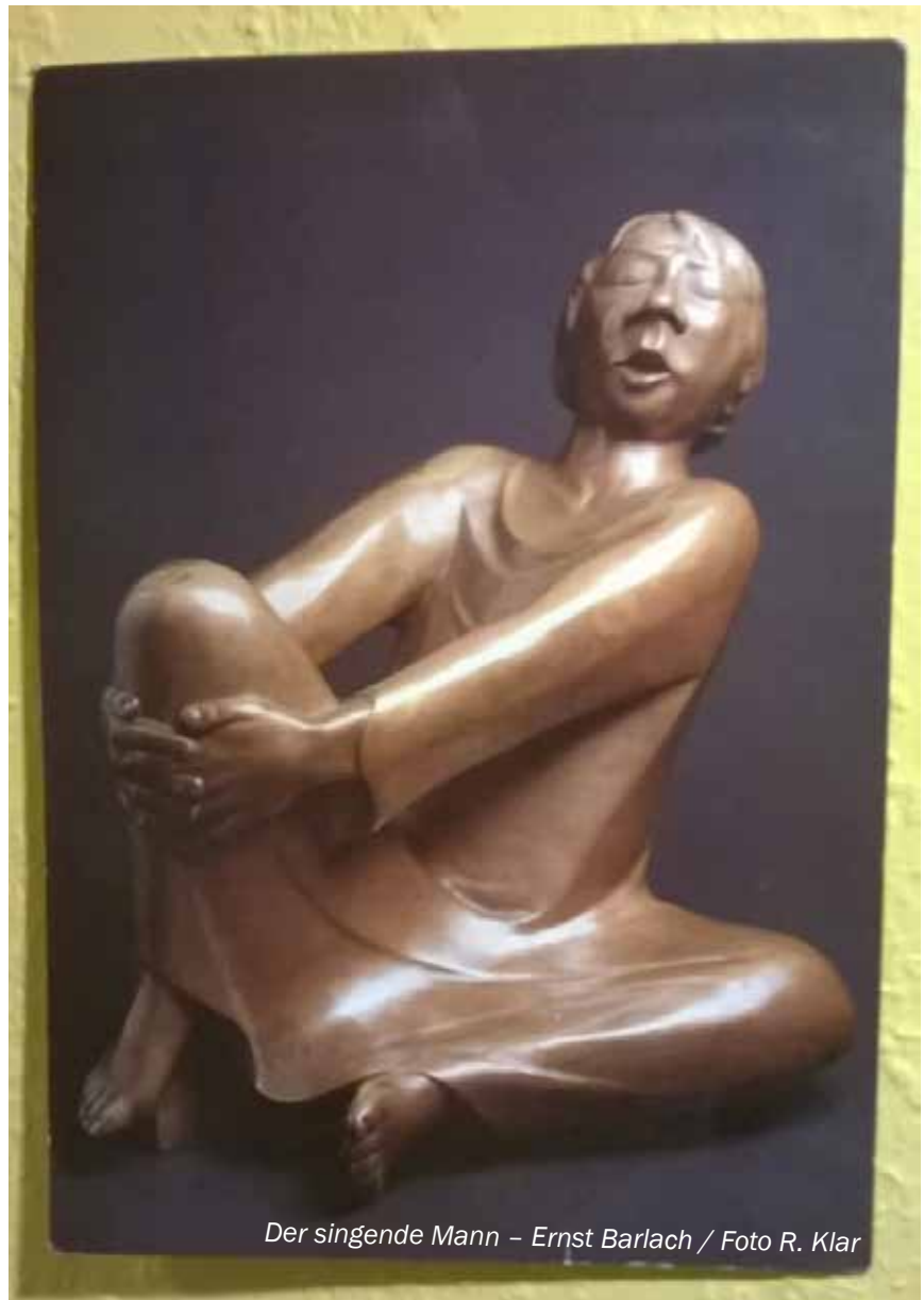
Der singende Mann – Ernst Barlach

Beuren - Bescheid - Damflos - Geisfeld - Gusenburg - Hermeskeil - Rascheid - Züsch