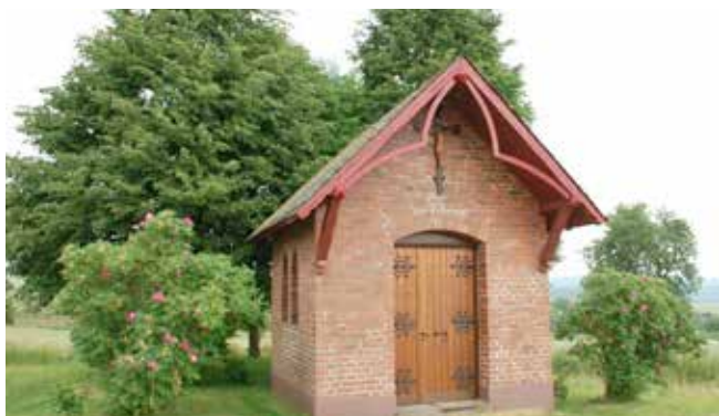
Die Beurener Herz Jesu-Kapelle an der Straße ins Dhrontal