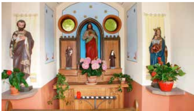
Die Kapelle im Innern

Diese Kapelle an der Straße ins Dhrontal wurde 1917, während des 1. Weltkriegs (also vor fast 100 Jahren), von einer Beurener Familie errichtet, deren Sohn eingezogen worden war. Bis in die 70er Jahre spielte die Kapelle auch im religiösen Leben der Pfarrei eine große Rolle, z. B. bei Bittprozessionen. Danach verfiel sie zusehends. Um 1990 wurde die Kapelle kostenlos an die Ortsgemeinde übergeben. Da sie als denkmalwürdig eingestuft war, kam ein Abriss nicht in Frage. Der Heimatverein nahm sich dann der Kapelle an und machte es sich zur Aufgabe, dieses dörfliche Kulturgut zu renovieren und zu erhalten. In den Jahren 1993 bis 1995 wurde die Kapelle für rund 25.000 DM saniert. Der Heimatverein erhielt dabei vielfältige Unterstützung, u. a. vom Landesamt für Denkmalpflege, vom Kreis Trier-Saarburg, von Gemeinde und Pfarrgemeinde, von der Frauengemeinschaft, der Sparkasse Trier-Saarburg und einer großen Zahl privater Spender. Am 05.11.1995 wurde die Herz Jesu-Kapelle feierlich eingeweiht. Mitglieder des Heimatvereins sorgen seither ehrenamtlich und kostenlos für die Reinigung, den Blumenschmuck und die Pflege der Außenanlage. Die Kapelle erfreut sich großer Beliebtheit, wie man häufig an brennenden Kerzen und Teelichtern sehen kann. Willi Seimetz, Beuren